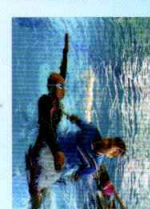
บาสเกตบอล